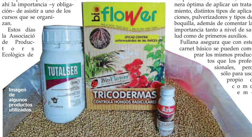
Imagen de algunos productos utilizados.